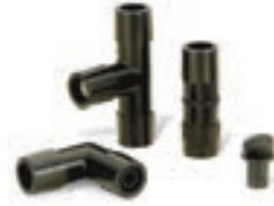
Accesorios de compresión rápida (pág. 115)