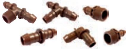
Accesorios de inserción para sistemas de tubería de goteo XF (pág. 114)