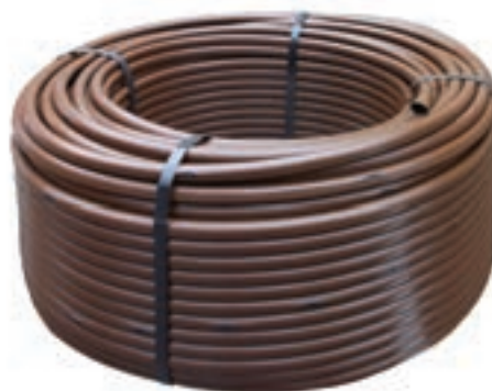
Tubería de goteo XFD