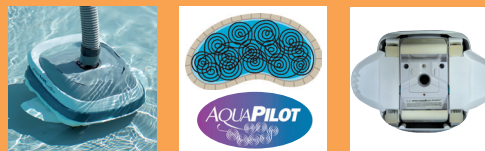
Sistema de orientação automático