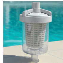
Trampa de hojas