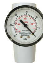
Manómetro de vácuo